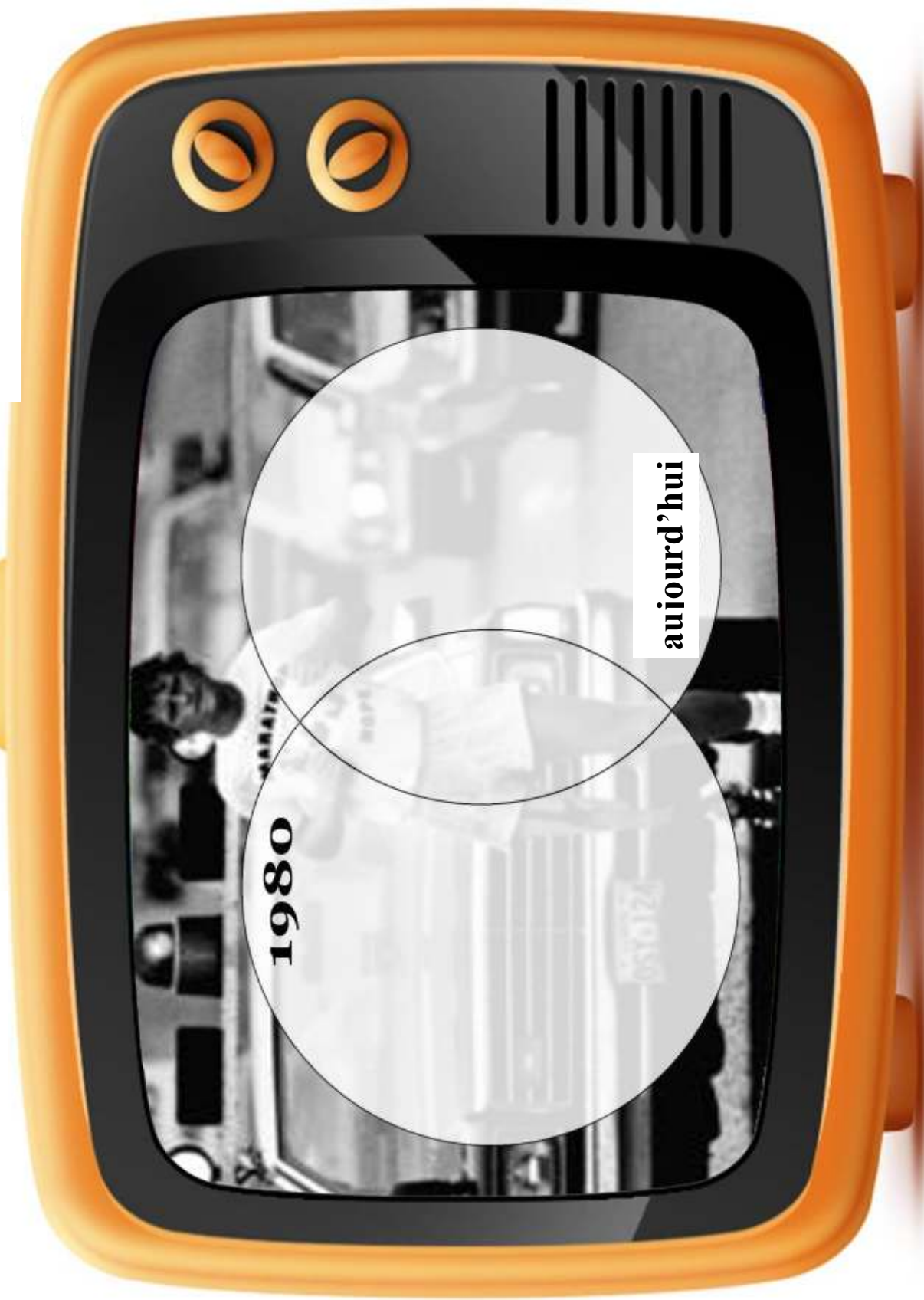
Diagramme de Venn